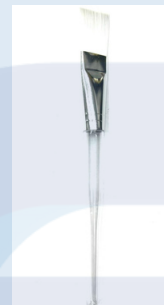
Cepillo de Limpieza