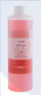
Solución de Calibración pH 4.00