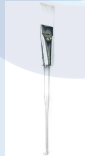
Cepillo de Limpieza