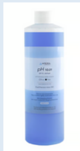
Solución de Calibración pH 10.01