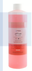
Solución de Calibración pH 4.00